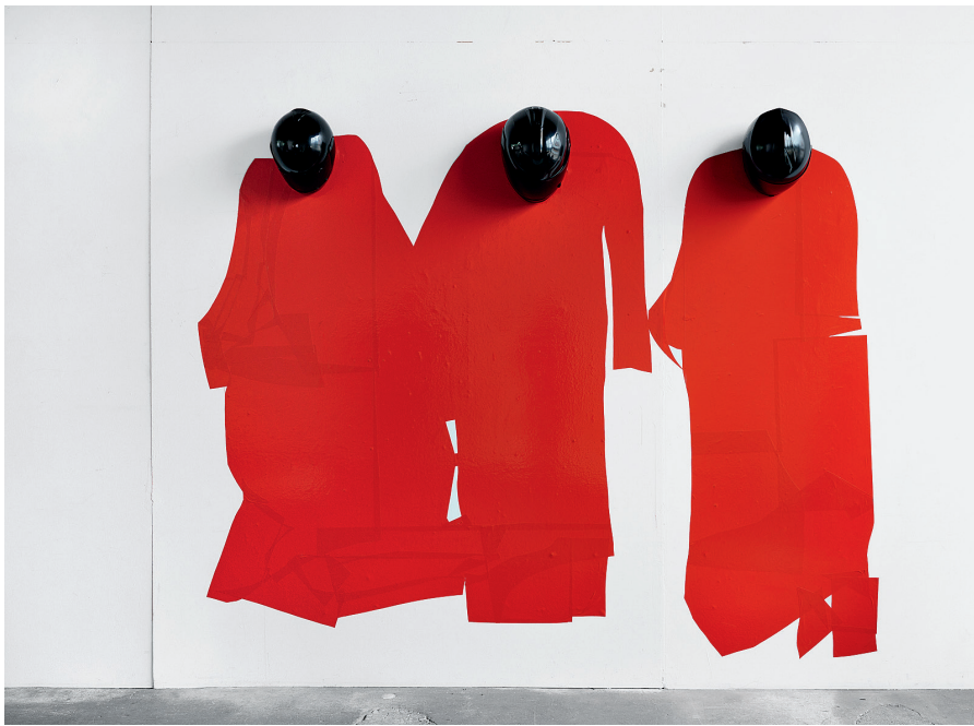
Gymball Stunt, 2015, Klebefolie, Motorradhelme, Acryllack, 230x280x27 cm, Courtesy Galerie Mark Müller, Zürich. Foto: Erwin Auf der Maur