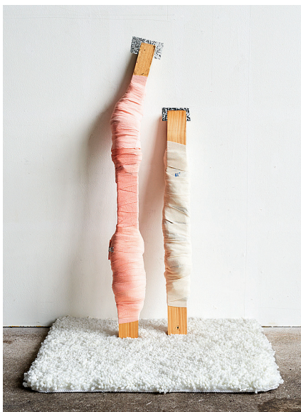
PR-15.3 (Löschblatt), 2015, Holz, gefärbter Verband, Badezimmerteppich, Klebefolie, 93x68x55 cm, Courtesy Galerie Mark Müller, Zürich. Foto: Erwin Auf der Maur