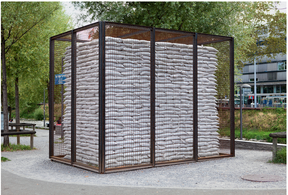
O.T., 2013, Projekt für «Gasträume 2013», Zürich, Stahlrohre, Drahtgitter, Sandsäcke, 250 x 375 x 250 cm, Courtesy Galerie Mark Müller, Zürich und Häusler Contemporary, München/Zürich. Foto: Conradin Frei