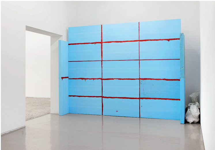
S-13.1, 2013, Schaumstoffplatten, Acryl, Ausstellungsansicht Galerie Mark Müller, Zürich, Sammlung Aargauer Kunsthaus.