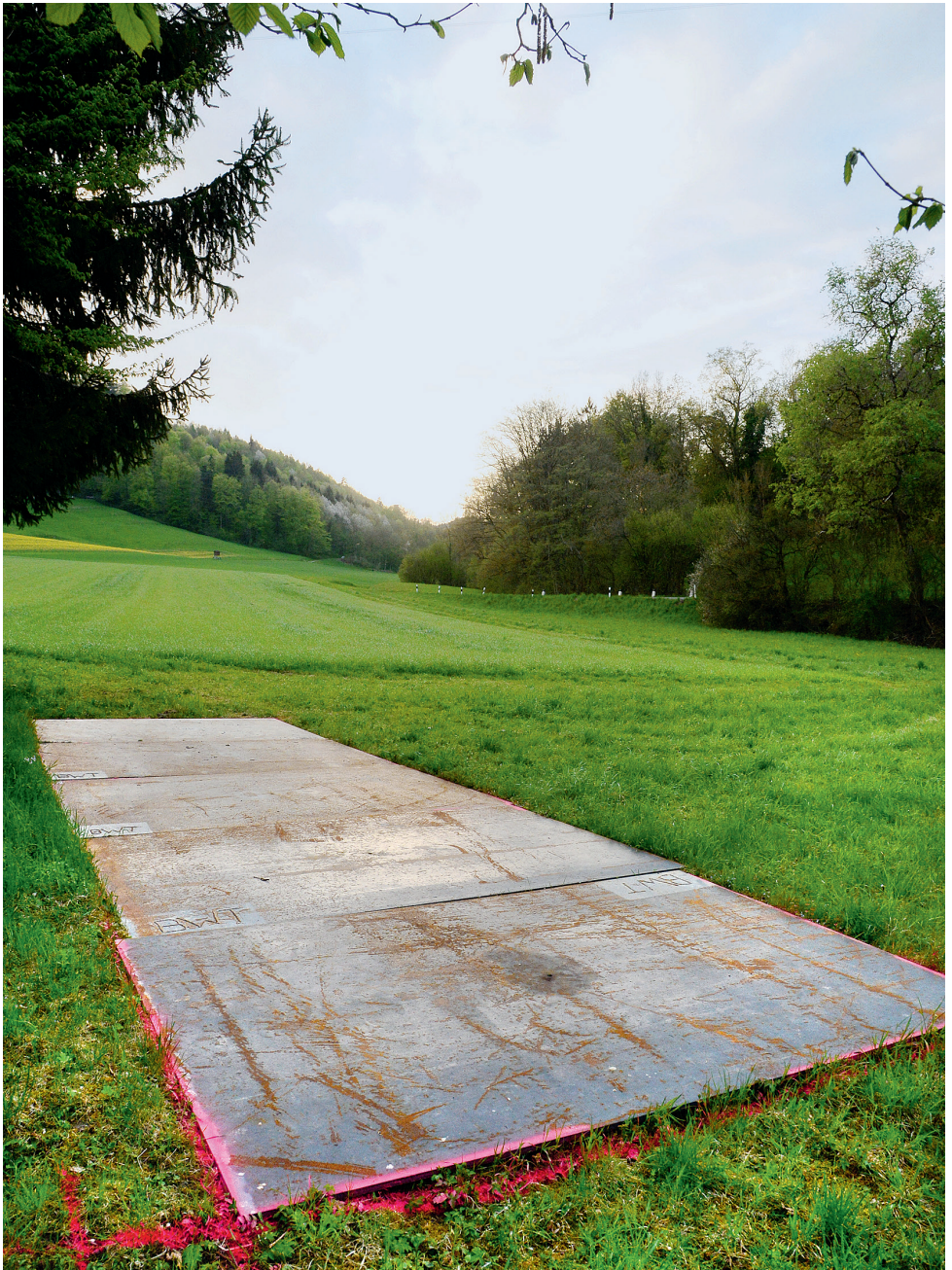
B-Side, 2015, Stahl, Spraylack, 300x1000x2 cm, Skulpturen-Symposium Weiertal.