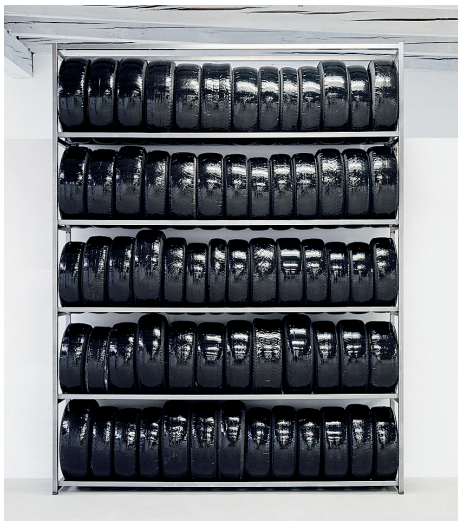
PN-11.1 (Aufsetzpunkt), 2011, Reifen, Metall, Klebefolie, 320x250x64 cm, Sammlung Ege, Kunst- und Kulturstiftung, Freiburg/B.